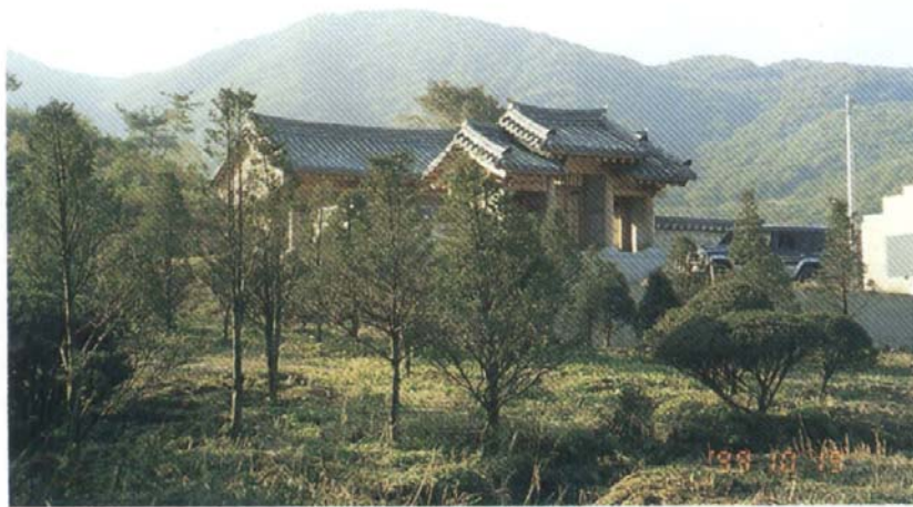
西平君 祠堂 丹青 前