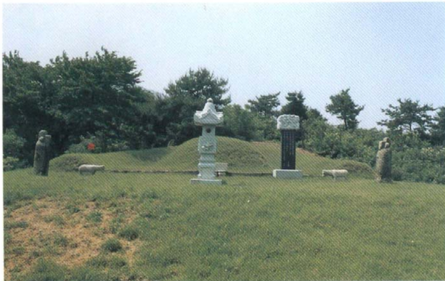
西平君 諱 之壽의 墓 京畿道 楊州郡 長興面 釜谷里