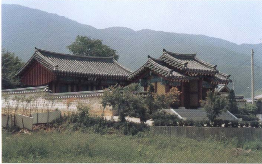
西平君 祠堂(清寧祠) 全景 京畿道 楊州市 長興面 釜谷里 318