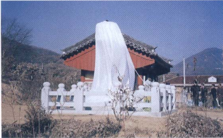
宗慕碑 除幕前 모습