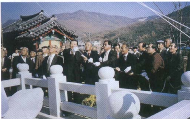
宗慕碑 除幕하는 모습