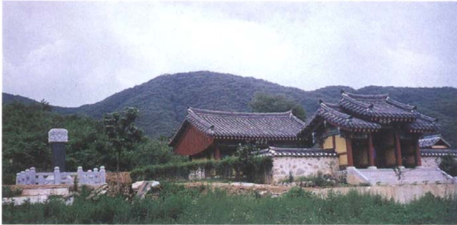
清寧祠 吳 崇墓碑 全景