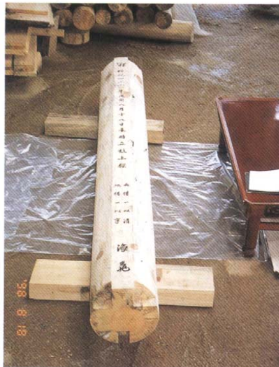
祠堂 上樑祿 올리기 前 (1998年 8月 18日)