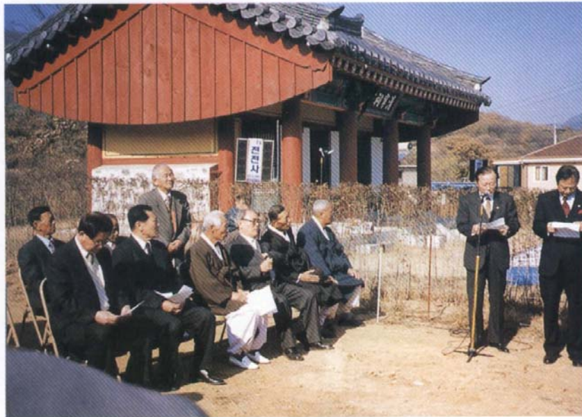
西平君 崇慕碑 除幕式 大宗會長 (澈愚) 紀念辭 場面