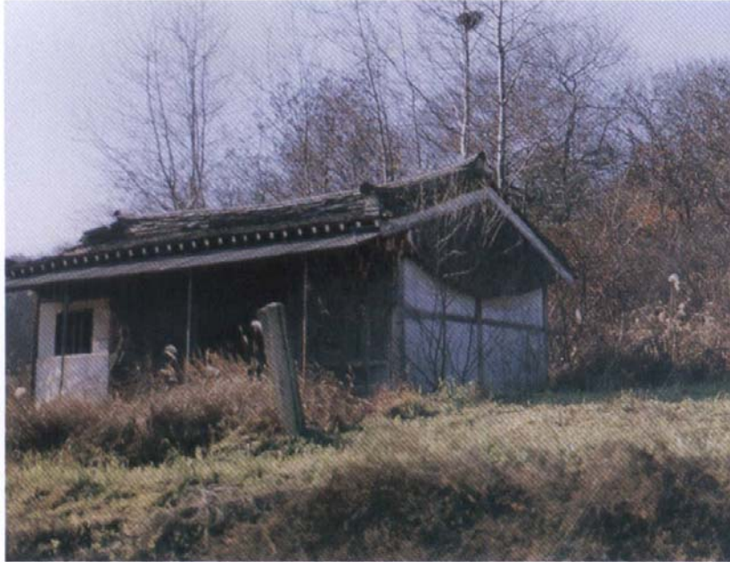
西平君 (舊) 齋室 (1982年 7月 建立)