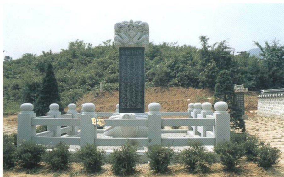
西平君 崇慕碑 (02. 10. 29 建立)