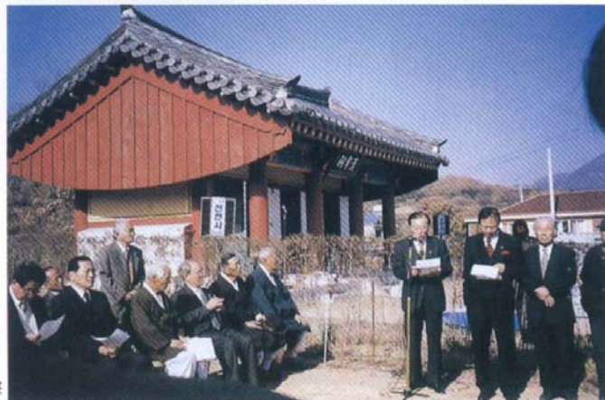
宗慕碑 除幕式에서 大宗會 澈愚會長 記念辭