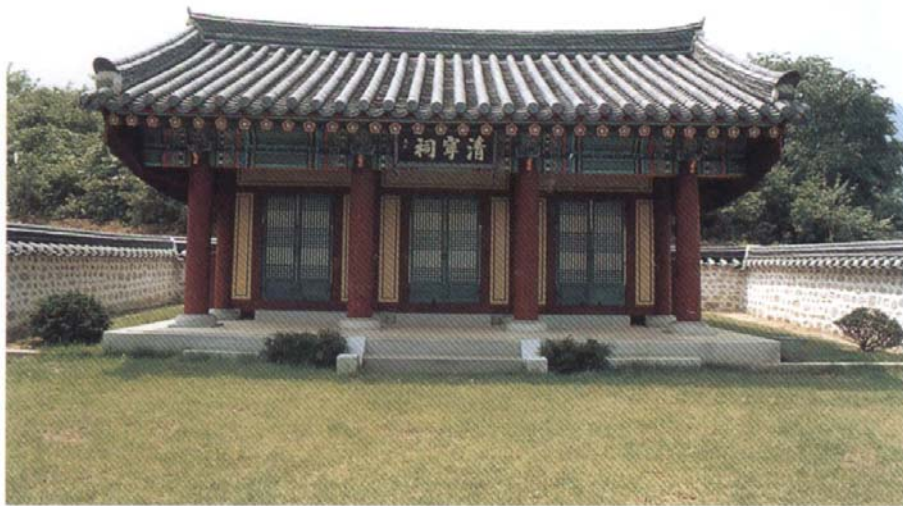
西平君 影堂(清寧祠) 2004年 6月 (담장工事 竣工 後)