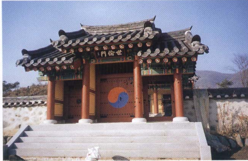
世倫門 (祠堂 앞 三門)