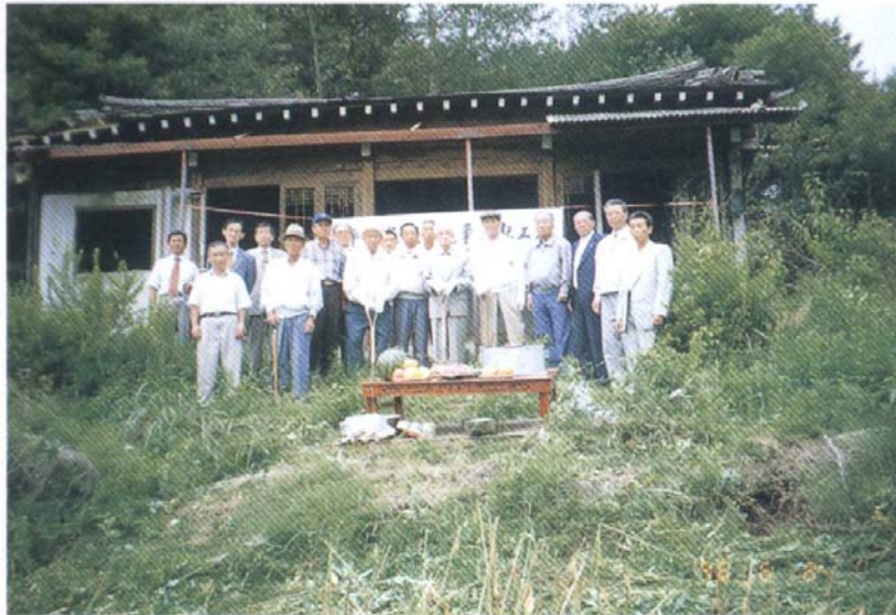
祠堂 新築工事 施工式 (1998年 6月 8日)