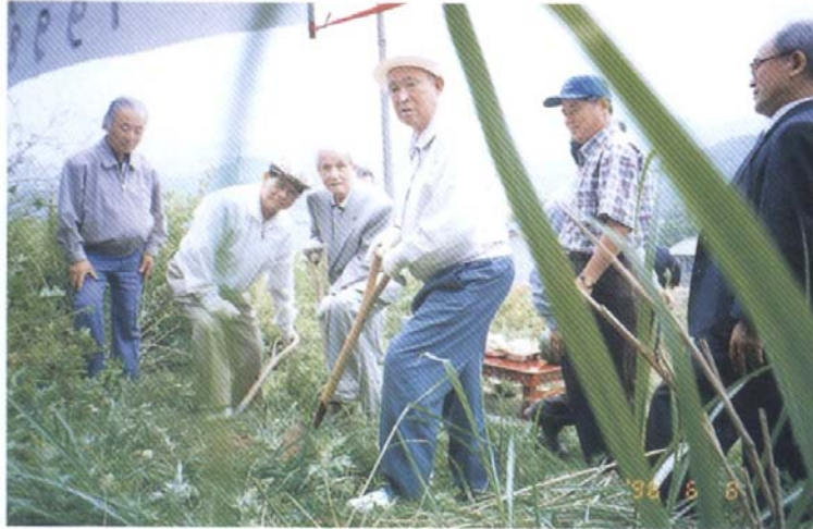
祠堂 新築工事 施工式 (1998年 6月 8日)