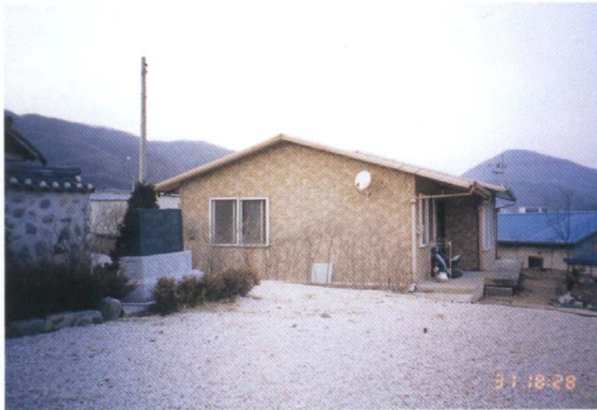
西平君 墓域 管理住宅 1999年 11月 25日 完工